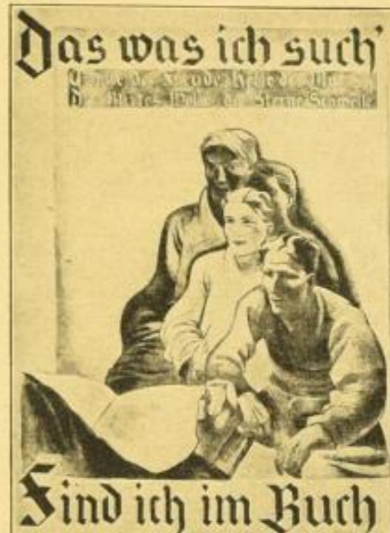
73:102 cm / RM —.40