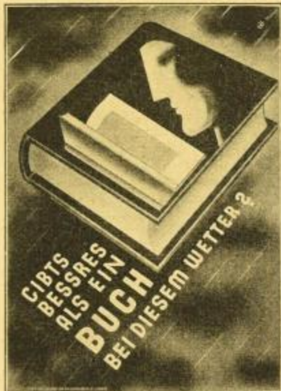
42:59,4 cm / RM —.50