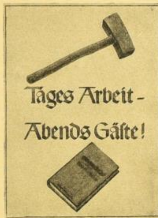
42:59,4 cm / RM —.40

Für die Plakate in der Größe von 42:59,4 cm paßt der schwarze, zusammenlegbare Holzrahmen, der die Wirkung bedeutend erhöht und nur RM 1.50 kostet.