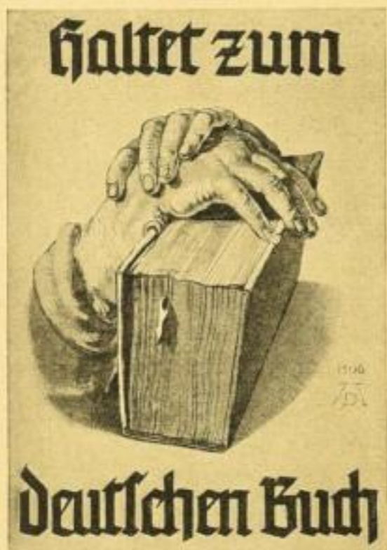
59:82,5 cm / RM —.40