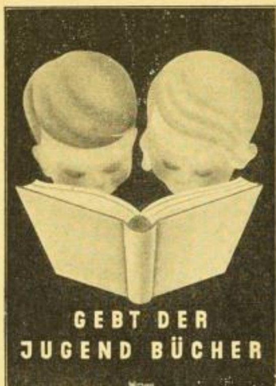
38:52 cm / RM —.50