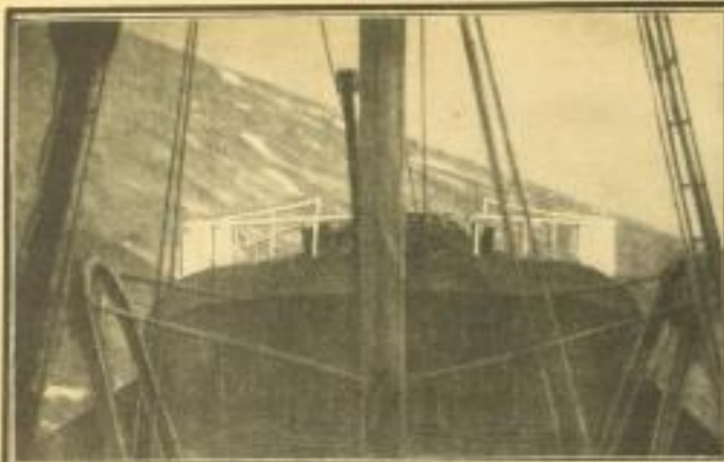
Das Innere des Schiffes — Diese man hat die P. und nicht hochgezogen photographiert. Ist die über wie eine kleine Stube der letzten Tage, am 12. 13. 14. Die Stube ist für die Dichtungen Prof.