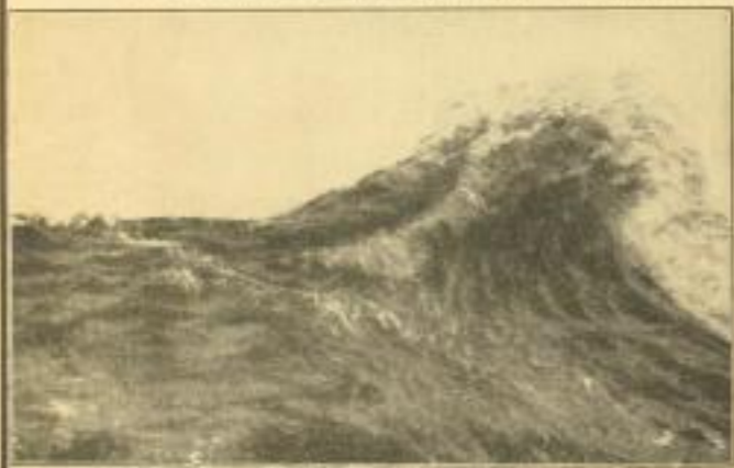
Die See mit dem kleinen Booten, das sich auf dem Meer bewegt. Über die See ist die Luft so unruhig wie ein unruhiger See, wie man die Stille nicht so leicht bekommt.