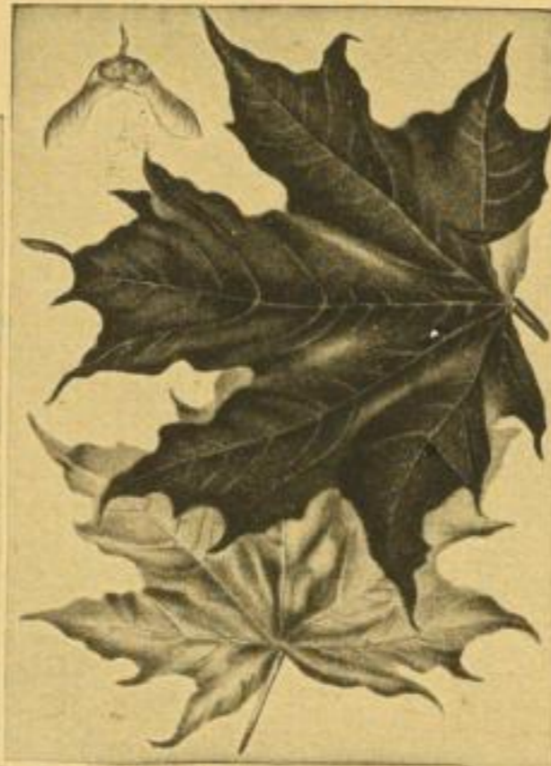
Aus „Bäume des deutschen Waldes“ (verkleinert)