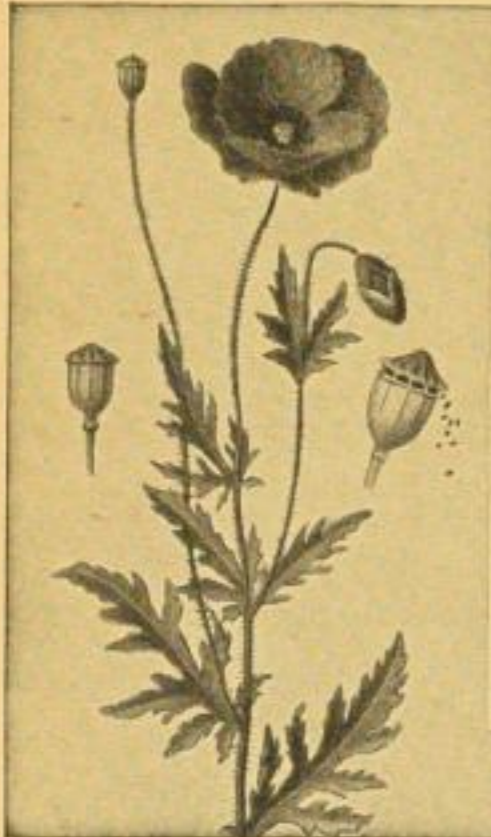
Aus „Früchte des Feldes“ (verkleinert)

Preis des geschmackvollen, farbigen Bandes 90 Pf. — Verlag J. J. Weber in Leipzig