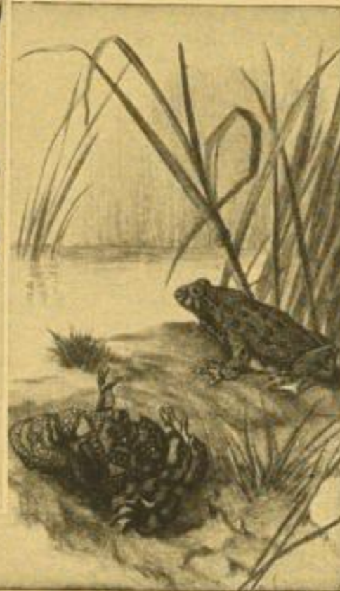
Aus „Der Wiesensteich und seine Lebensgemeinschaft“ (verkleinert)

Diese 4 Bilder im Buche in sechsfarbigem Offsetdruck