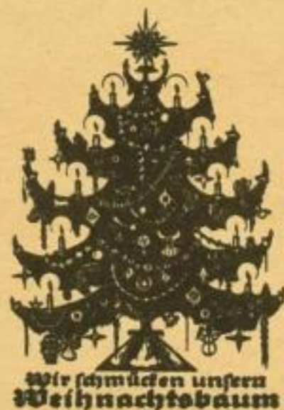
Wir schmücken unseren Weihnachtsbaum