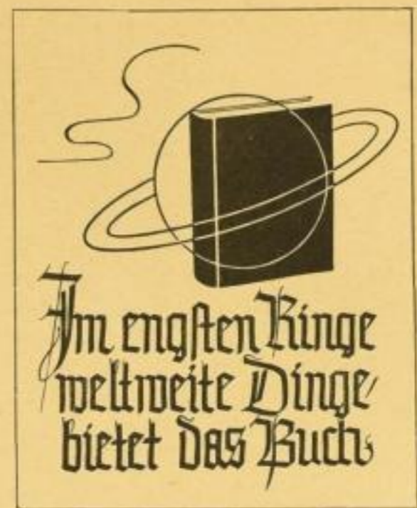
XII wird ohne Rand geliefert