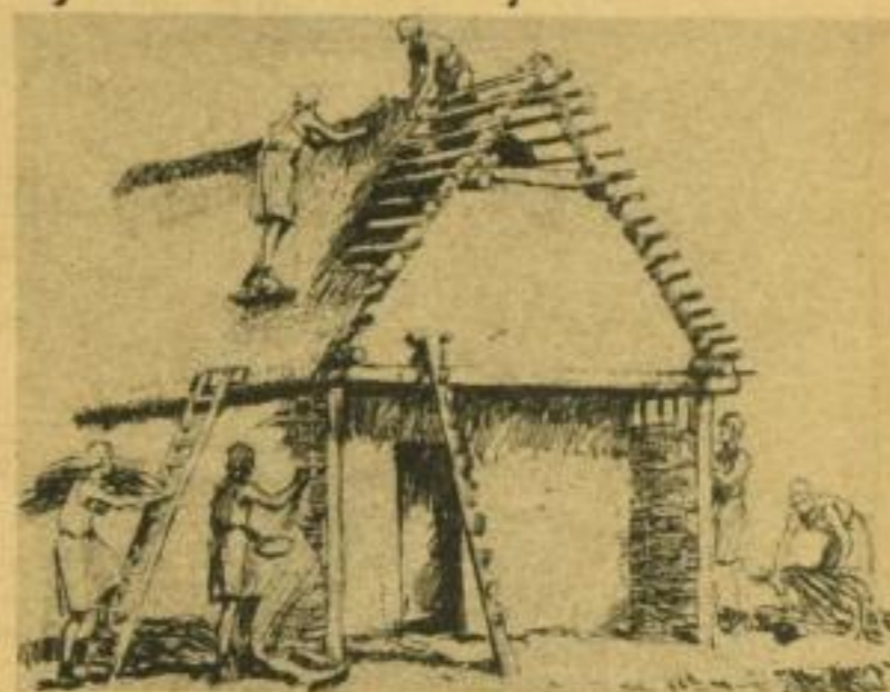
Abb. 166, 169 (stark verkl.) aus: