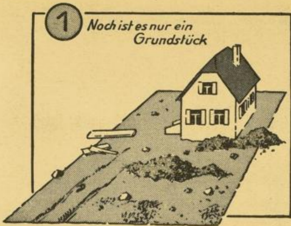
1 Noch ist es nur ein Grundstück

„Schon die geschmackvolle Aufmachung und sinnvolle Gliederung des Buches lassen beinahe erraten, daß sein Inhalt keine mühsam ausgepreßte Trockenmasse ist. In der Tat, das Werk ist gleichsam von dem Wurzeln, Wachsen, Blühen, Duftend und Werden erfüllt, inmitten welchen es unzweifelhaft mit herzlicher Naturhingabe und eindringlichem Naturverstehen erstand und in lebendigem flusse geschrieben und trefflich bebildert wurde, kurz, das in reicher fülle neuartig behandelte Wissens-