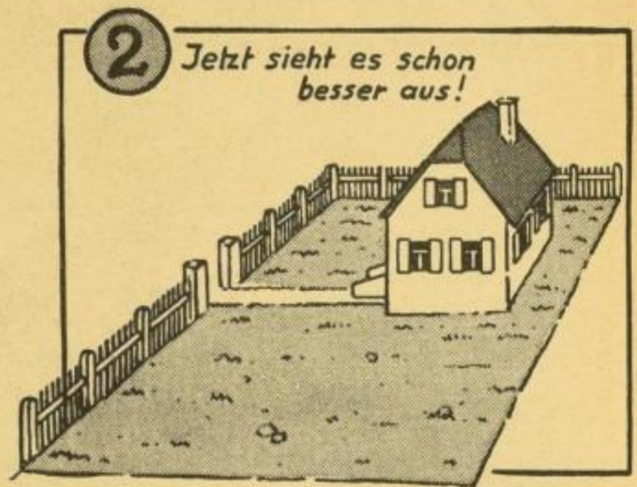
2 Jetzt sieht es schon besser aus!

gut zeugt von Selbsterproben und Selbstbeherrichen aller wirtschaftlichen und anlagetechnischen Gartenbaufragen, des Gartenliebhabers, zeugt von einem selbst-eigenen, innigen Erleben einer gereiften Gartenwohnkultur. Das von den Verfassern gesetzte Ziel kann deshalb wohl auch nur sein: Freude und Erfolg eines jeden werdenden, jungen und alten Gartenfreundes zu mehren und zu ihrem höchstmaße zu verhelfen. Das preiswerte Buch, in die vier unterteilten hauptteile: