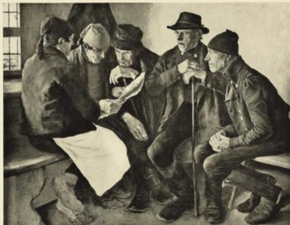
WILHELM LEIBL: Die sogenannten Dorfpolitiker