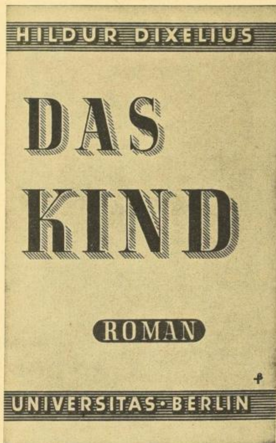
Verkleinerte Abbildung des mehrfarbigen Schutzumschlages