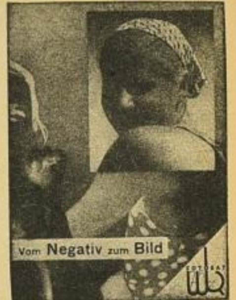
Vom Negativ zum Bild