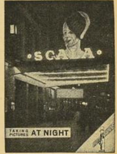
TAKING PICTURES AT NIGHT