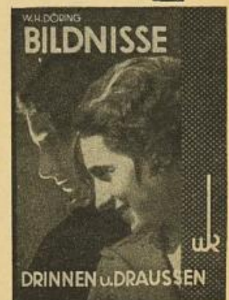
DRINNEN u. DRAUSSEN