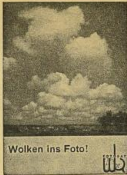
Wolken ins Foto!