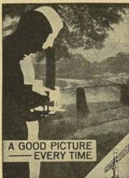
A GOOD PICTURE EVERY TIME