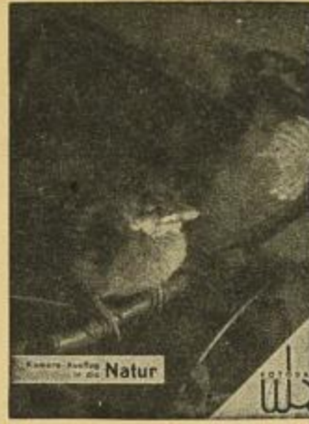
Kamera-Ausflug in die Natur