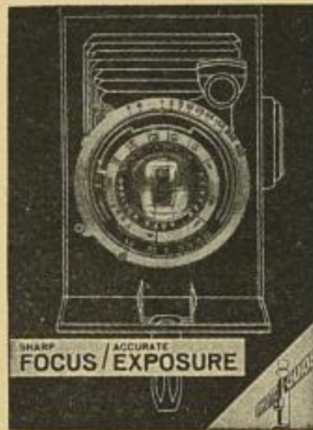
SHARP FOCUS / ACCURATE EXPOSURE