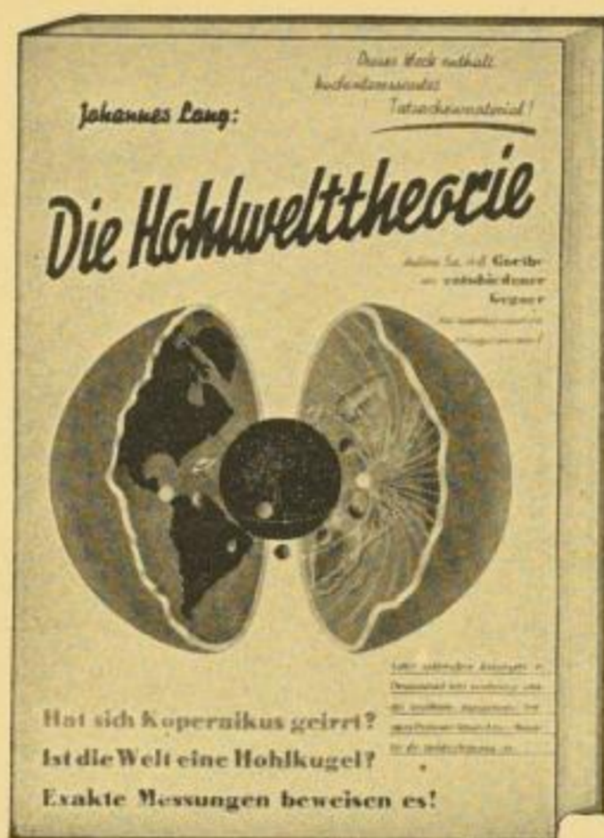
(Schutzumschl. in wirkungsvoll. Vierfarbendruck)