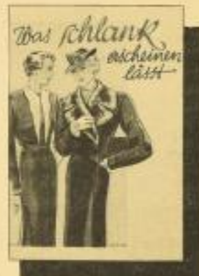
Was schlank erscheinen lässt Eine Spezialausgabe mit ca. 90 praktischen Modellen - für jede Gelegenheit - für Damen. RM 1.- ord.