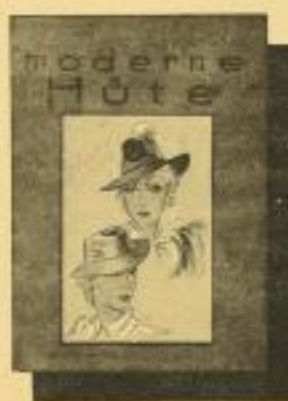
Moderne Hüte Eine Spezialausgabe! Hatmodelle mit über 60 Originalmodellen, von denen 40 handkoloriert sind. - RM 2.50 ord.