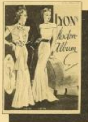
Lyon's Moden-Album Saisonangabe mit ca. 200 Modellen für jede Gelegenheit und für jedes Alter. Mit Schnittbogen. RM 1.50 ord.