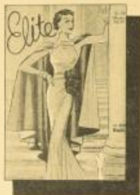
Elite Das elegante Halbjahresalbum mit ca. 300 Modellen in kunstvoller, farbiger Darstellung. - RM 2.50 ord.