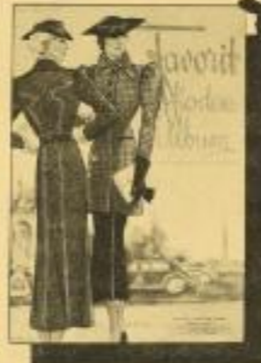
Favorit-Modenalbum Eine Spezialausgabe mit ca. 300 Modellen für Erwachsene und Kinder. Mit Schnittmusterbogen. - RM 0.95 ord.