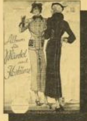
Album für Mäntel und Kostüme Eine Ausgabe mit über 200 Modellen in teilweise farbiger Darstellung für Erwachsene und Kinder. - RM 2.50 ord.