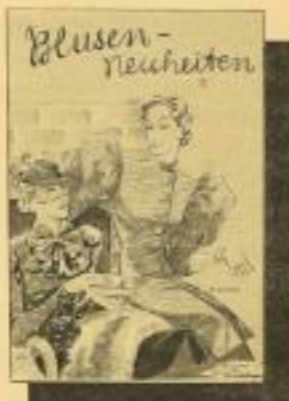
Blusen-Neuheiten Diese Spezial-Ausgabe bringt zisk. 150 Modelle von eleganten Blusen, Kostüm- und Röcken. - RM 1.25 ord.