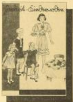
Favorit-Kindermoden Mit Schnittbogen. - 200 prick. Modelle für jedes Alter und für jede Gelegenheit. Teilfarbige Darstellung. RM 0.75 ord.