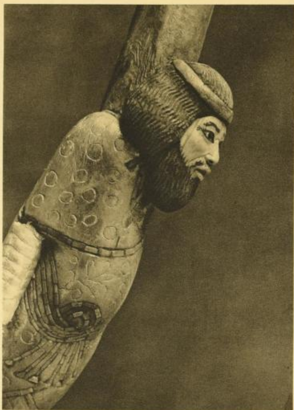
BILDNIS EINES ASIATEN

Bemalte Elfenbeinplastik von einem Prunkstab. Um 1350 v. Chr. Kairo, Museum