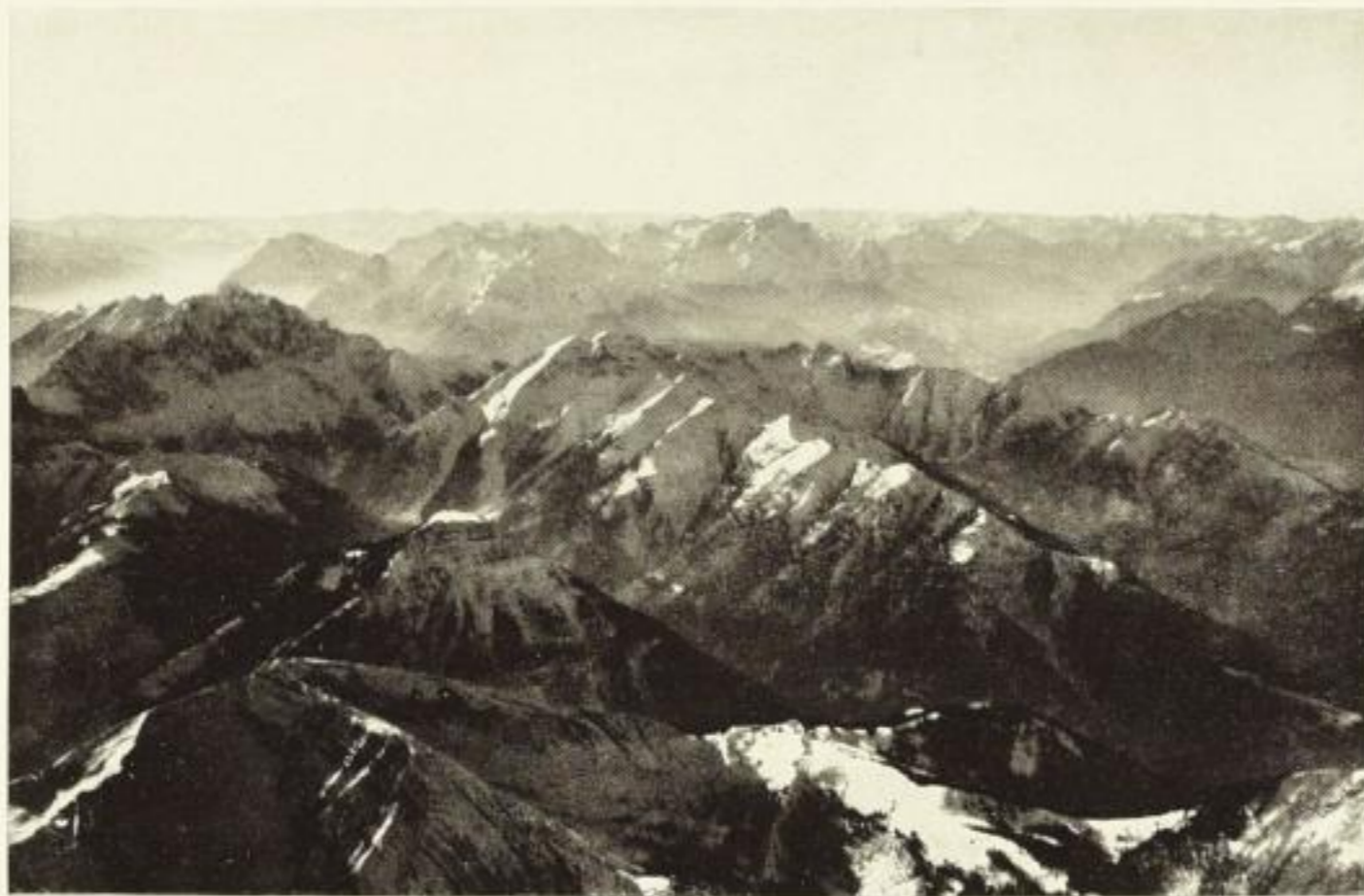
Das Wetterstein- und Karwendelgebirge, in denen der Kettencharakter, aber auch die Wildheit der Nördlichen Kalkalpen zur vollen Entfaltung kommt.