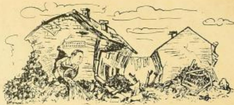
„In der Arbeiterstadt Nr. 1 . . .“ (Woch. „Pravda“ vom 16.3.1934)

Sammel-Bestellung Die Unterzeichneten bestellen bei der Buchhandlung