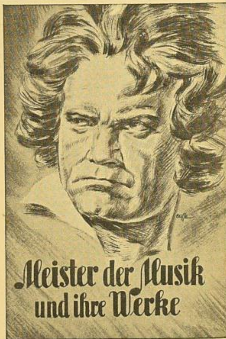
Mit 26 Bildern auf Tafeln, 5 Bildern im Text sowie zahlreichen Notenbeispielen. Format 13,5 x 20,5 cm. Ganzleinen RM 3.80

In diesem Buche, das keineswegs eine ermüdende Musikgeschichte ist, sind Leben und Werke der großen Meister der Musik in lebendiger Form dargestellt: Schütz und Bach, Händel und Gluck, Haydn, Mozart, Beethoven, Schubert, Weber, Schumann, Chopin, Liszt, Wagner, Verdi, Brahms, Wolf, Bruckner, Strauß, Reger, Puccini und Pfitzner. Zugleich wird auch die gemeinsame Grundlage aufgezeigt, auf der diese Großen ihre Werke schufen und Kapitel zusammenfassender Art weisen auf die Verbindungen hin. Eines davon ist der Musik der Germanen gewidmet, ein anderes behandelt die Musik bis zum Ausgang des 16. Jahrhunderts. Hervorgehoben seien auch die Abschnitte über die Meister der Oper und Operette sowie die Meister des Auslandes. Den Abschluß bildet der Beitrag „Musik in der Gemeinschaft“, der bis zum Kampf- und Gemeinschaftslied unserer Zeit führt. So ist hier ein Buch entstanden, das Frische mit Gründlichkeit verbindet, das jedem Musikfreunde Anregung und Freude bereitet.