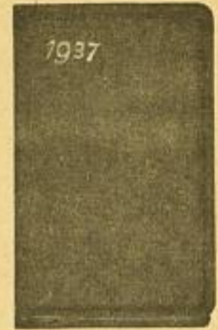
Nr. 4, Größe 7×11 cm je Woche 2 Seiten (Dünndruck)