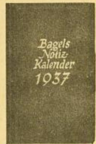
Nr. 9, Größe 8×13 cm je Woche 2 Seiten