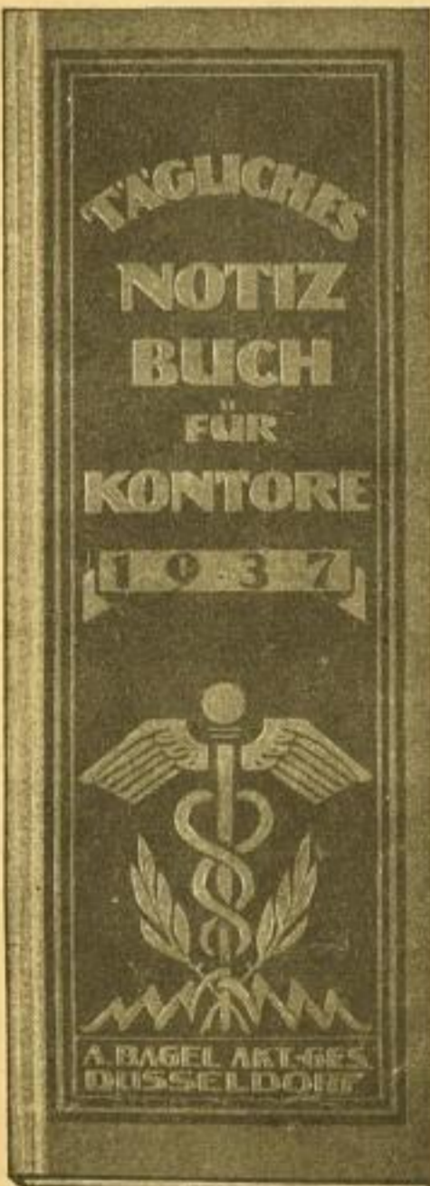
Nr. 11, Größe 11×31 cm, mit Anhang Nr. 11 a, Größe wie vor, ohne Anhang je Tag 1/2 Seite Nr. 11 b, je Tag 1 Seite, mit Anhang famit. in Halbleinen

Die Taschenkalender sind lieferbar in Kaliko und echtem Ledereinband