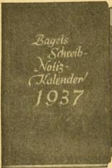
Nr. 5, Größe 10×15 cm je Tag 1 Seite