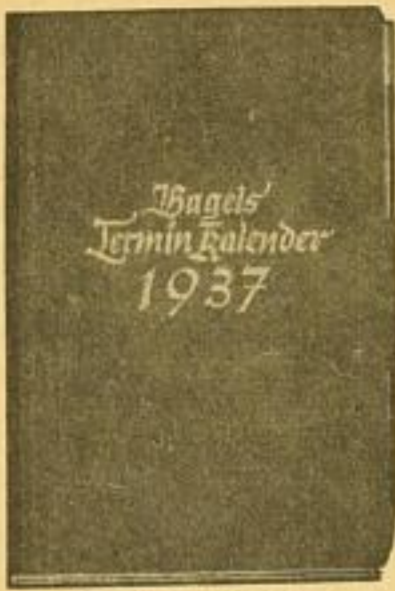
Nr. 2, Größe 10×15 cm je Tag 1/2 Seite