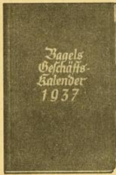
Nr. 6, Größe 10×15 cm je Woche 2 Seiten