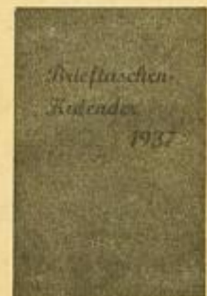
Nr. 13, Größe 6 1/2×10 cm je Monat 1 Seite kartoniert