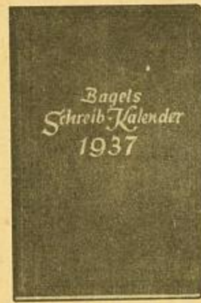
Nr. 7, Größe 10×15 cm je Woche 2 Seiten rechte Seite frei