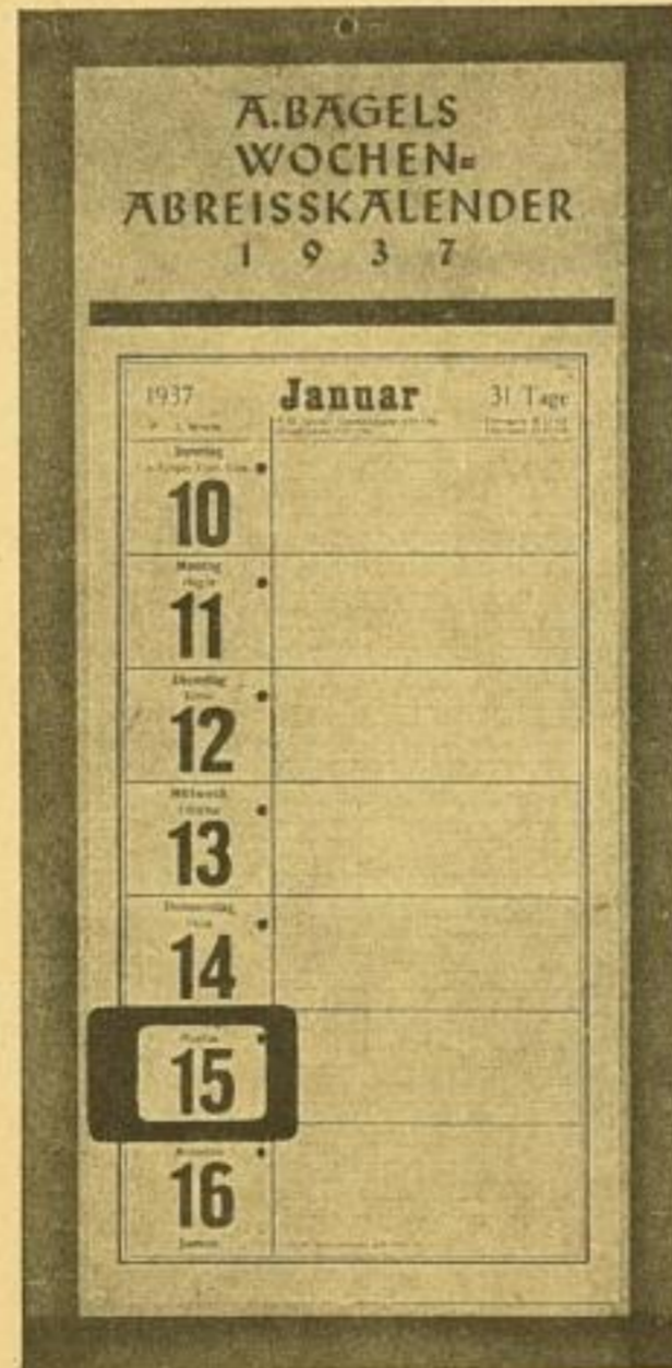
Nr. 1 mit Rückwand und farbigem Datumanzeiger, Größe 17×35 cm (Blattgröße 13 1/2×25 1/2 cm) in mehrfarbigem Steindruck