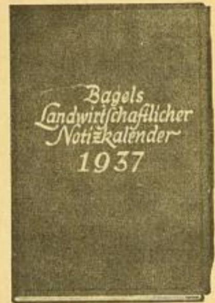
Nr. 8, Größe 10×15 cm je Woche 2 Seiten mit Märkteverzeichnis

Die Taschenkalender sind lieferbar in Kaliko und echtem Ledereinband