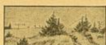
Schütze 1 bedingt den Feind durch Schützen des Zuges.