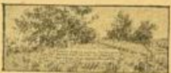
Die Truppe darf kein Schützen abgeben, wenn sich der Feind über die Feuergruppe verhalten hat.