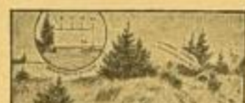
Der Schütze des U. S. G. Truppe prüft den Schützen 1 unmittelbar das Ziel.