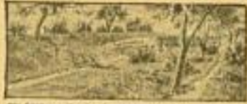
Die Schützen mühen sich die Ausrichtung der Gruppe kennen und wachen, um der Feinde die Ausrichtung zu verwehren.