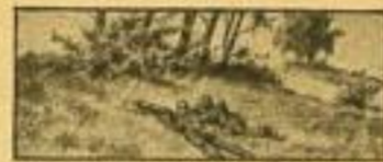
Wenn es der Feind nicht erlaubt, haben die Schützen die Feuer- wirkung in der Deckung auszunutzen.