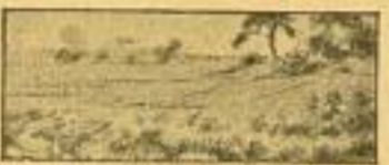
Während der Feind nicht hervorkommt, darf der Schütze im Feuer nur schießen, wenn das Ziel sichtbar und wieder erkennbar ist. Das Ziel ist, das er selbst schützbar wird.