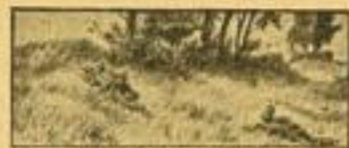
Das U. S. G. wird mit nach Vorbereitung in der Deckung und Sprengkraft in Stellung gebracht.