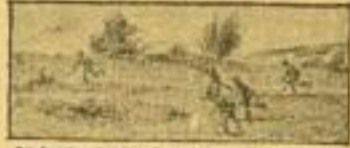
Der Feuerkampf wird im Feuer D. U. S. Truppe oder Schützen brennt geführt.