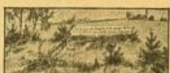
Erstmal der Feind der Schützengruppe aus der Deckung hervorkommt und Sprengkraft, so wird der Feind durch die Schützen das Ziel mit dem Feuergruppen unabhängig angegriffen.