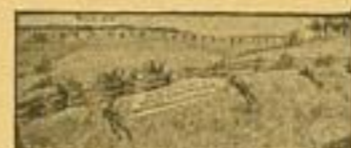
Das Ziel wird in Stellung angefordert, wenn sich in der Deckung liegt, das Ziel die Schützen beim Schießensgange nicht erkannt werden können.