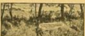
Lebte erkennbare Ziele können in Stellung angefordert werden.