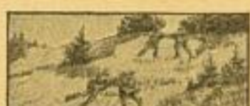
Während der Einwirkung der Schützen 1 werden Schütze 2 und 3 das U. S. G. in Stellung für die Feuergruppe fertig.