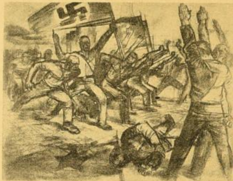
1. Der Tag kommt! Nach einer Zeichnung (1923) Bildgröße 61,5 x 79,5 cm. RM. 1.75

Unentgeltlicher Wandplakat für Diensträume von Behörden sowie für Geschäftsstellen der NSDAP und ihrer Gliederungen