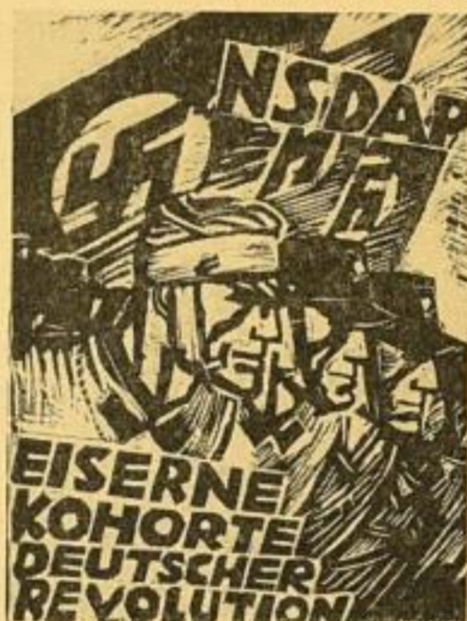
4. Eiserne Kohorte deutscher Revolution Nach einem Linoleumschnitt (1927) Bildgröße 79 x 59,5 cm. RM. 1.75