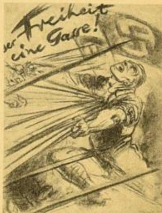
6. Der Freiheit eine Gasse! Nach einer Zeichnung (1927) Bildgröße 39,5 x 30 cm. RM. 1.25