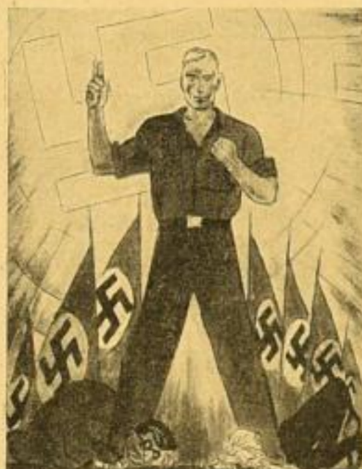
8. Wir! Nach einer Zeichnung (1931) Bildgröße 39,5 x 30 cm. RM. 1.25