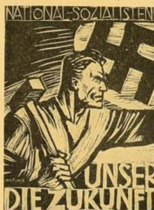
3. Unser die Zukunft Nach einem Linoleumschnitt (1927) Bildgröße 79,5 x 58 cm. RM. 1.75