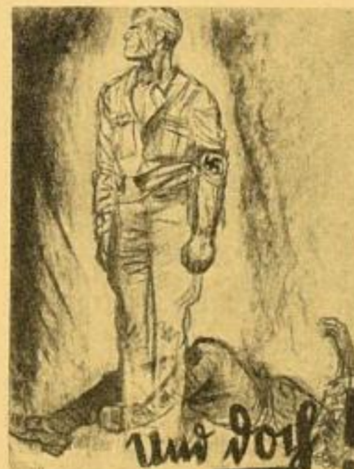
7. Und doch! Nach einer Zeichnung (1927) Bildgröße 39,5 x 30 cm. RM. 1.25

Reichsdruckerei / Abteilung Verlag / Berlin SW 68 / Oranienstraße 91