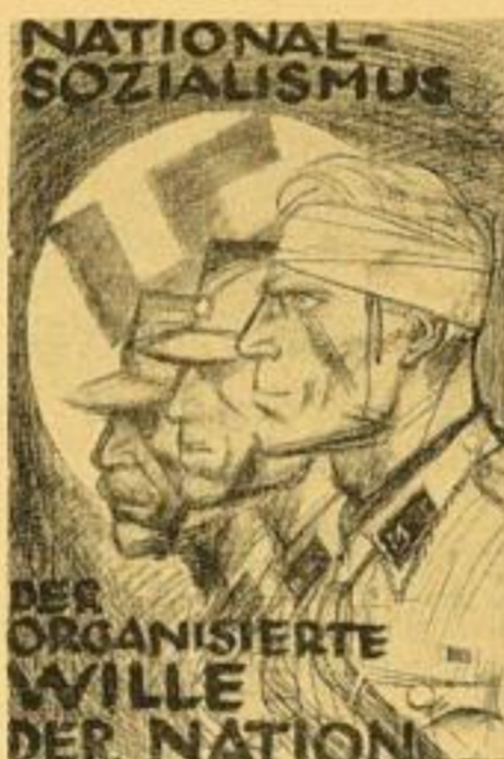
5. Der organisierte Wille der Nation Nach einer Zeichnung (1931) Bildgröße 80 x 52,5 cm. RM. 1.75