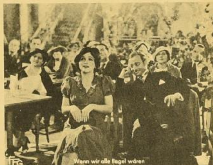
Kempenich auf Abwegen