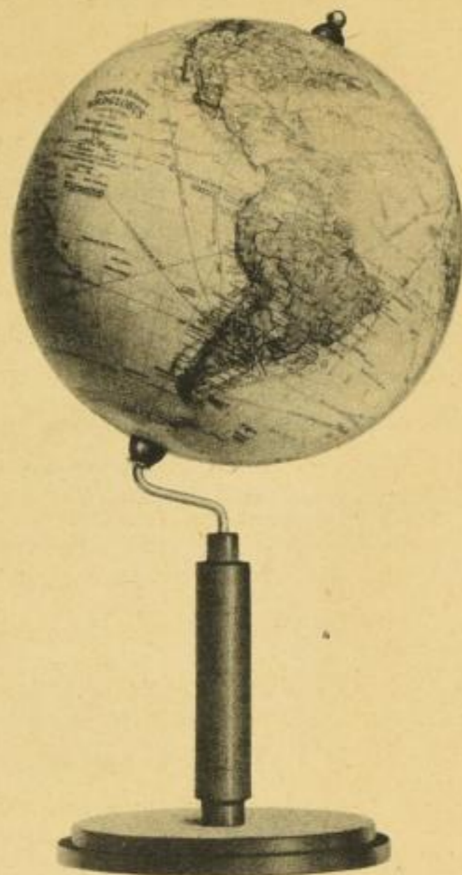
Dietrich Reimers Erdglobus Nr. 46

Karl Rauch Verlag, Markkleeberg b. Leipzig