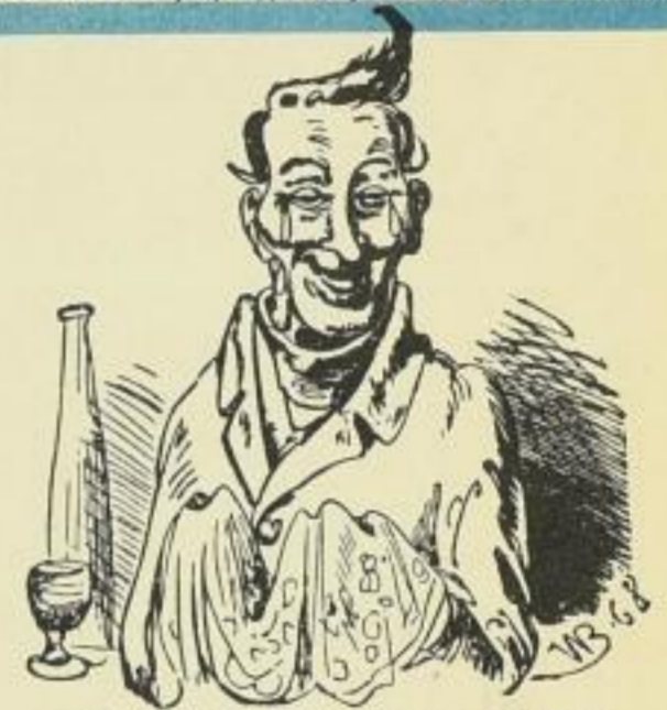
Ja! - Sehr erheitert uns die Preise, Vorausgesetzt, daß man auch niese!

Original seines Geburtshauses auf der Rückseite nach einem Entwurf von Kunstmaler Hans Hähnel • In schönem Natur-Ganzleinenband mit Futteral.