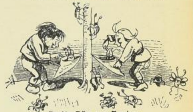
In die Tüte von Papiere Sperren sie die Krabbeltiere.