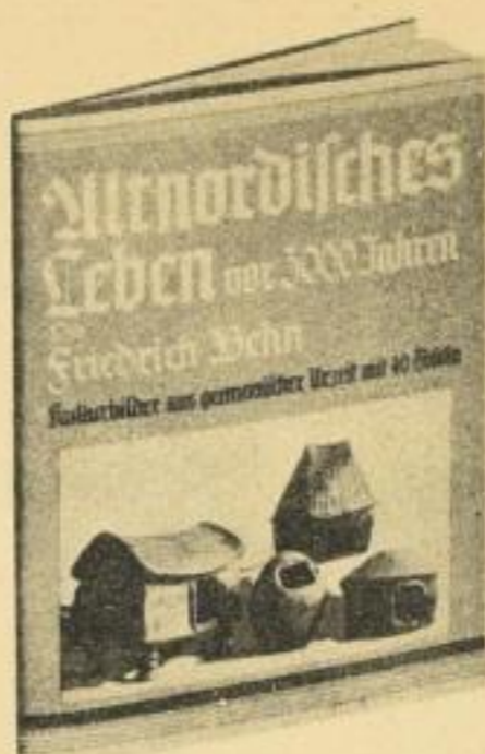
Kart. RM 3.—