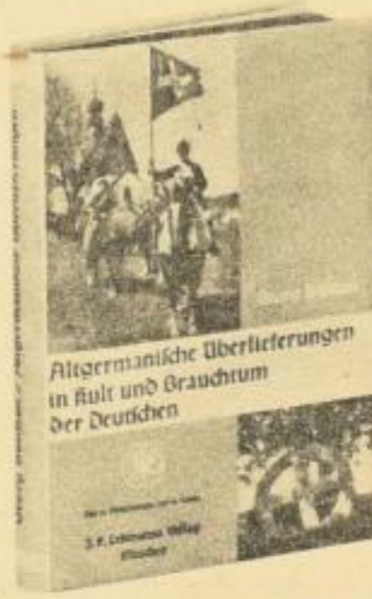
Geh. RM 6.60, Lwd. RM 7.80