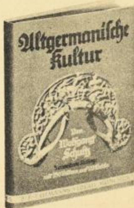
Geh. RM 6.—, Lwd. RM 7.50