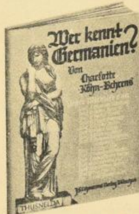
Kart. RM 4.—, Lwd. RM 5.—