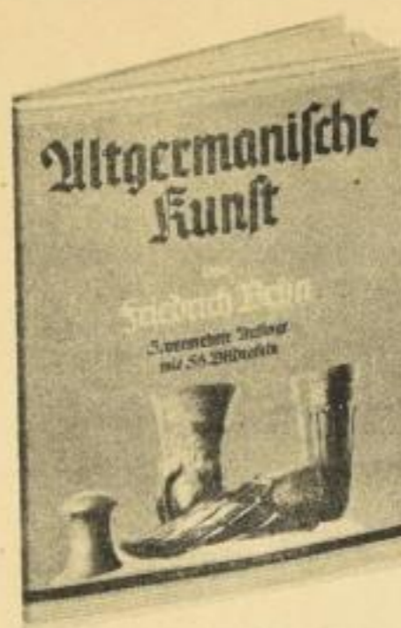
Kart. RM 3.60