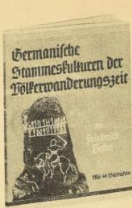
Kart. RM 3.—