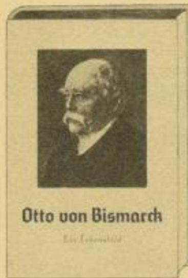
Otto von Bismarck

Ganzleinenband mit Bildumschlag Rm. 4.80