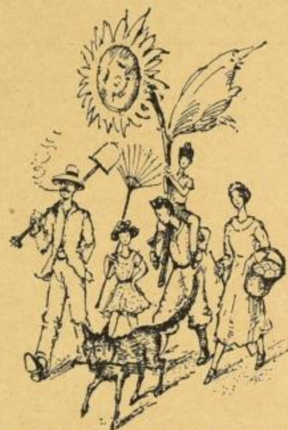
Die Zeichnungen auf dieser Seite stammen aus „Sonnenblumen und Radieschen“