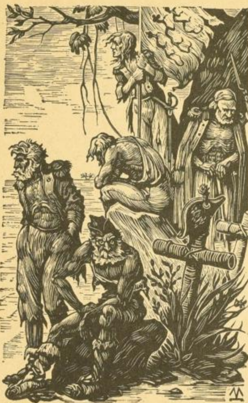
Mit einem ganzseitigen Holzschnitt von Karl Mahr