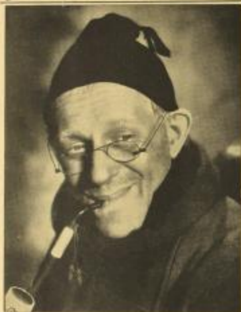
Dieses sorgfältig auf Karton aufgezeichnete Originalfoto der Titelfigur (Format 34x45 cm) liefern wir Ihnen kostenlos als Blickfang für Ihr Schaufenster.

Uraufführung den neuen Syndikat-Film „Meiseken“