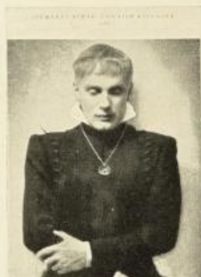
Bühne und Film