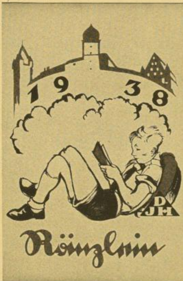
Für Jungen und Mädchen