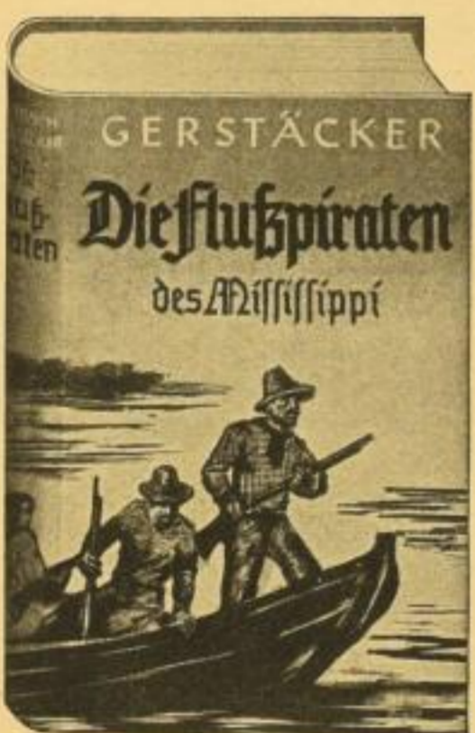
Im Kampf mit Piraten auf einer Insel im Mississippi