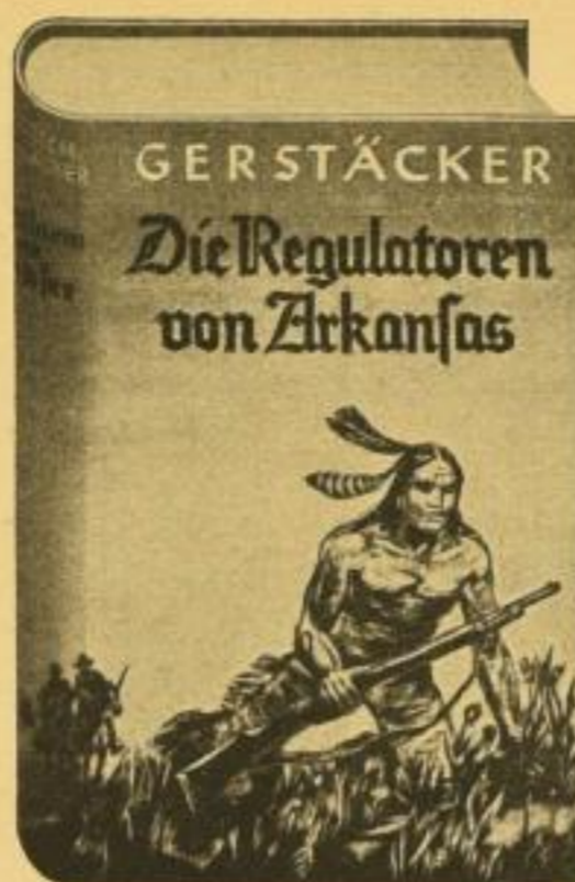
Der erbitterte Kampf der Farmer um Freiheit gegen Gewalt und Verbrechen