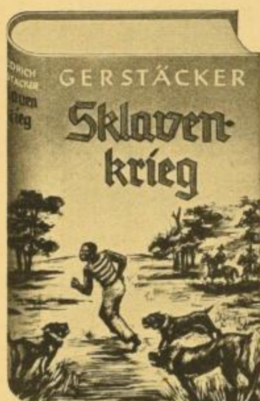
Ein packender Roman aus den amerikanischen Südstaaten