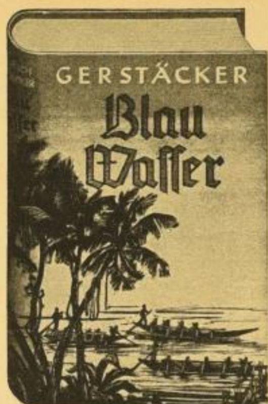
Herrliche und bunte Abenteuer zur See aus aller Welt