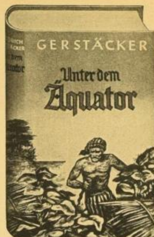
Ein lebensnaher Roman aus der tropischen Welt Javas

„Das, was Gerstäcker uns Heutigen wieder lesenswert und groß macht, ist seine echte Schilderung der fernen, teils schon versunkenen Welt. Seine Werke sind Kulturdokumente, wie es sie in dieser volkstümlichen Form kaum ein zweites Mal gibt.“