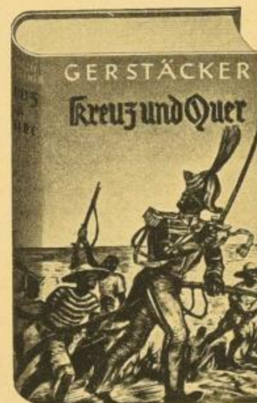
Erzählungen aus dem nordamerikanischen Sezessionskrieg u. a.