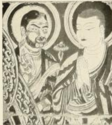
Frühmittelalterliches Wandgemälde von Sanzid (Offenfurt) mit blondem präfrontalen Typus und blondem Chignon

WERBEMITTEL: Reich bebildertes Prospekt (4 S. Din A 4), Platzat mit 10 Abbildungen in beidseitiger Ansicht zum Aufhängen in Kommission.