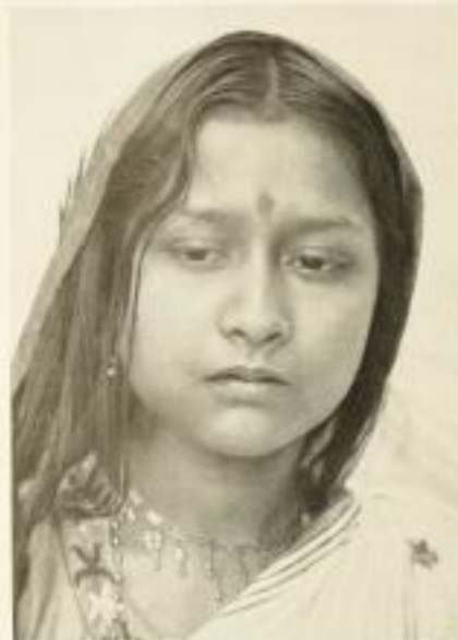
Junge Frau aus Bengalen (arische Sprachgebiet)