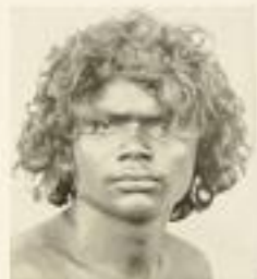
Mann und Frau vom Stamm der Papuaner aus den Papuanen (Melanesische Rasse, malayische Typus)

WERBEMITTEL: Reich bebildertes Prospekt (4 S. Din A 4), Platzat mit 10 Abbildungen in beidseitiger Ansicht zum Aufhängen in Kommission.