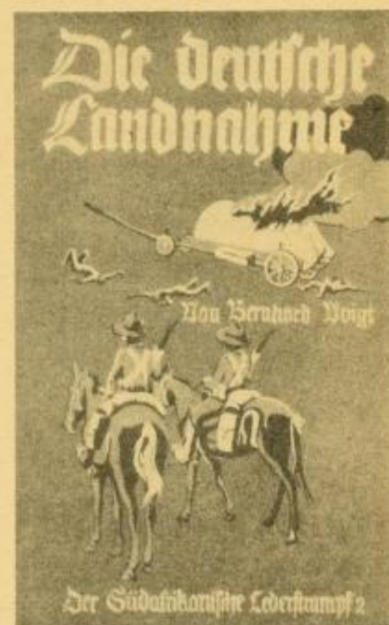
Der Südafrikanische Lederstrumpf 2 (Der südafrikanische Lederstrumpf, Band 2) 384 S. Kart. RM 4.—, Leinen RM 5.20