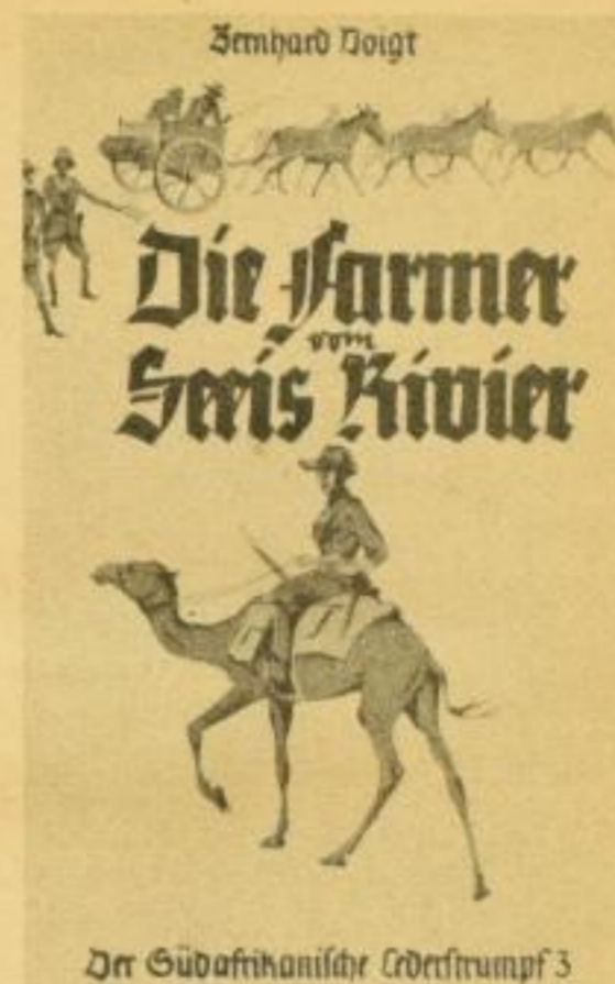
Der Südafrikanische Lederstrumpf 3 (Der südafrikanische Lederstrumpf, Band 3) 420 S. Kart. RM 4.80, Ganzl. RM 5.80