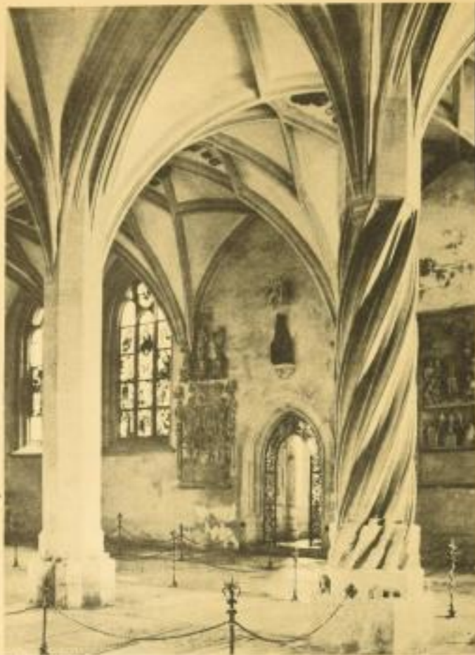
Dom in Eichstätt