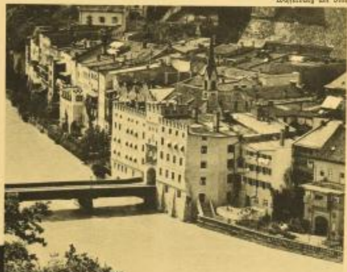
Wasserburg am Inn