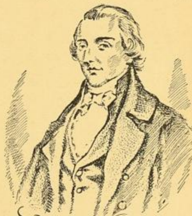
Johann Philipp Palm Buchhändler zu Nürnberg 1766-1806

Fränkische Tageszeitung / Nürnberg, 11. 8. 1938