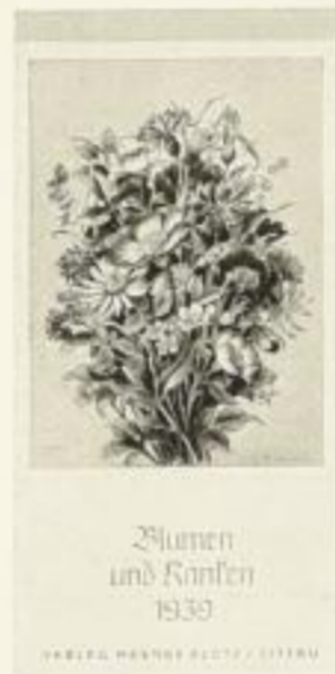
13 Postkarten XMR 1.40 in Vierfarbendruck