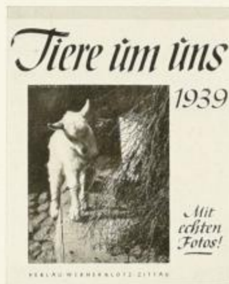
24 Postkarten XMR 2.-