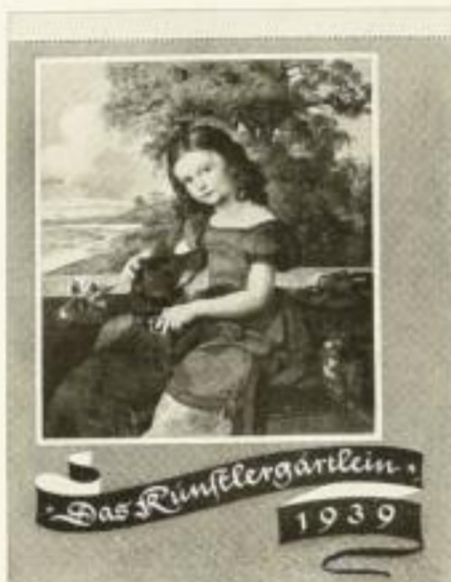
Bilder deutscher Maler XMR 1.25