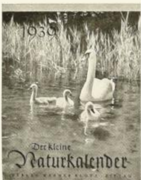
13 Postkarten XMR 1.25