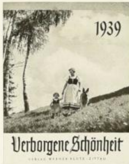
Schönes aus dem Alltag XMR 1.25