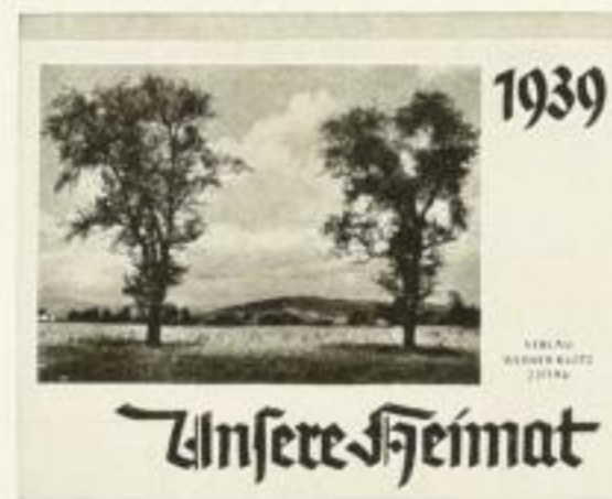
13 Postkarten, Aufstell-Vorr. XMR 0.80 Landschaften