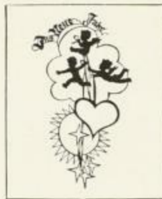
Aus dem Plischke- Jahrweiser 1939 XMR 1.50 (bel. Vertriebsgebiete)