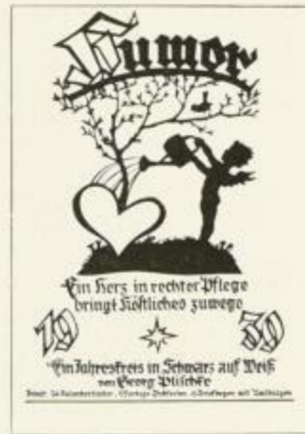
Der große Plischke- Jahrweiser m. bunten Postkarten XMR 2.40