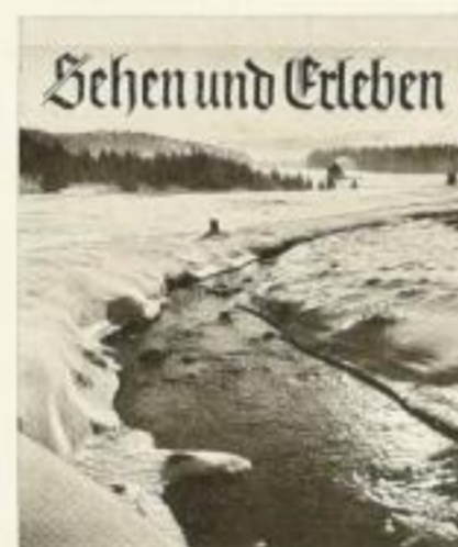
24 abtrennb. Postkarten XMR 1.-