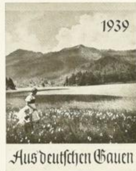
13 Postkarten XMR 1.25