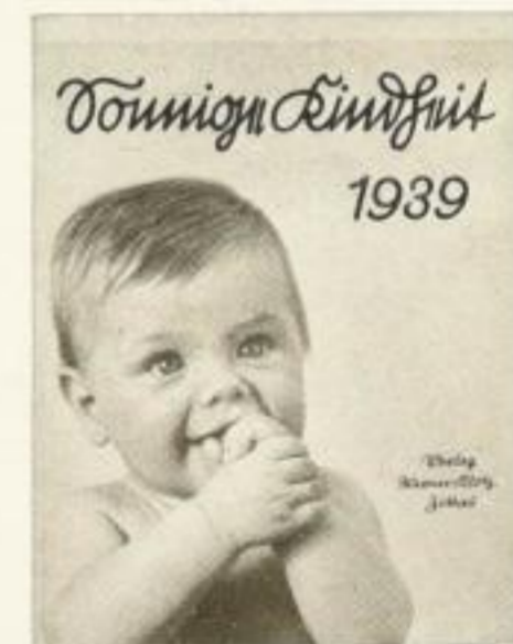
13 Postkarten XMR 1.25

Photos und Gemälde in hervorragenden einfarbigen und bunten Wiedergaben Erlesenes Spruchgut, Großformat-Postkarten, übersichtliches Kalendarium und Schreibraum