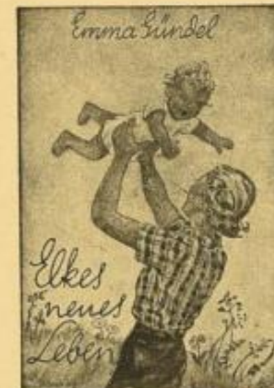
Band 6 (Nr. 13-16)