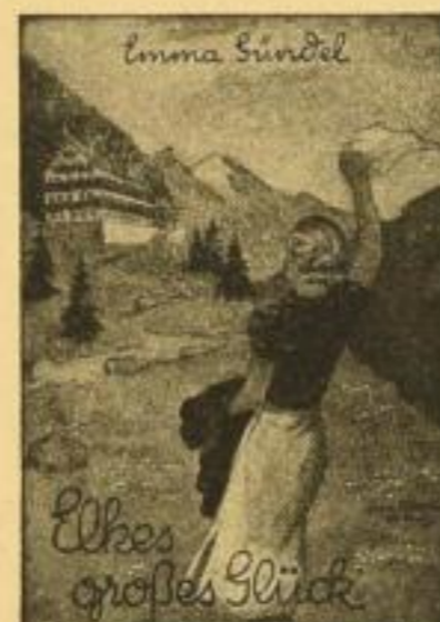
Band 5 (Nr. 13-16)