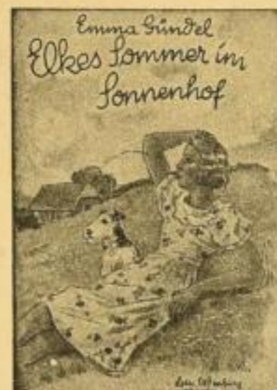
Band 2 (Nr. 10-14) 2. Auflage