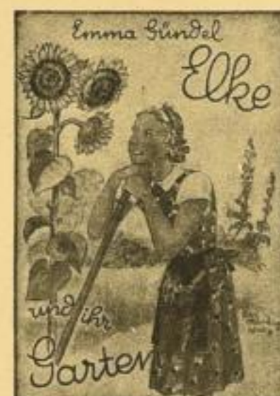
Band 4 (Nr. 13-16)