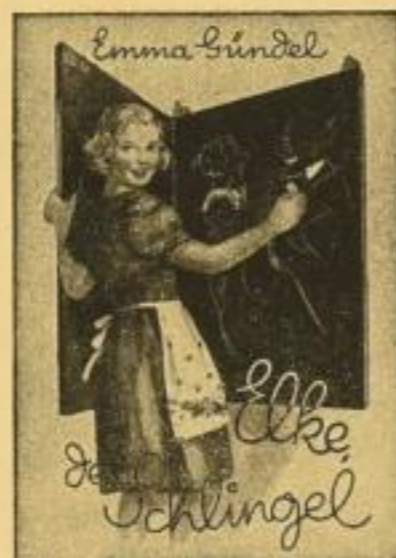
Band 1 (Nr. 8-13) 2. Auflage

der große Erfolg und ein Erlebnis für jede Leserin