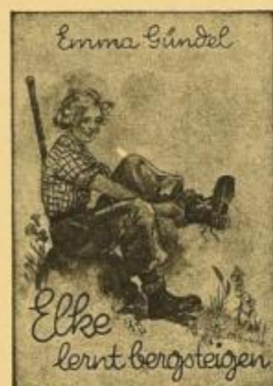
Band 3 (Nr. 10-14)