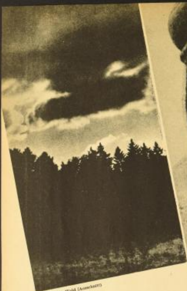
Absch. Oberer Wald (Ausschnitt)