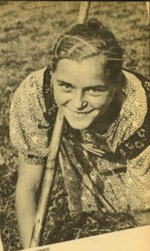
Beim Hosen (Ausschnitt)