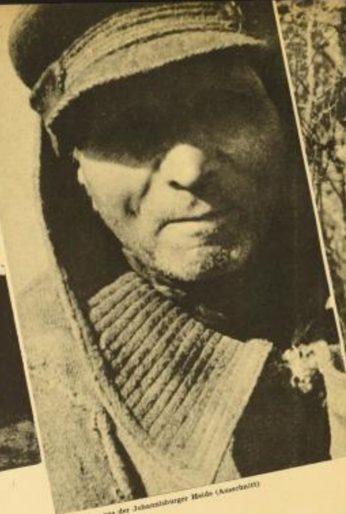
Alter Bauer aus der Jauerniger Wälder (Ausschnitt)