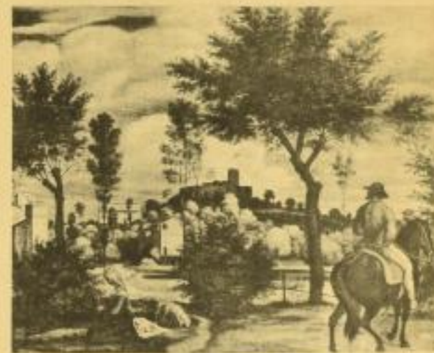
von Ludwig Goetz. Umfang 400 Seiten mit 250 Abb. Vorbest.-Preis bis 15. XI. nur 16.— RM