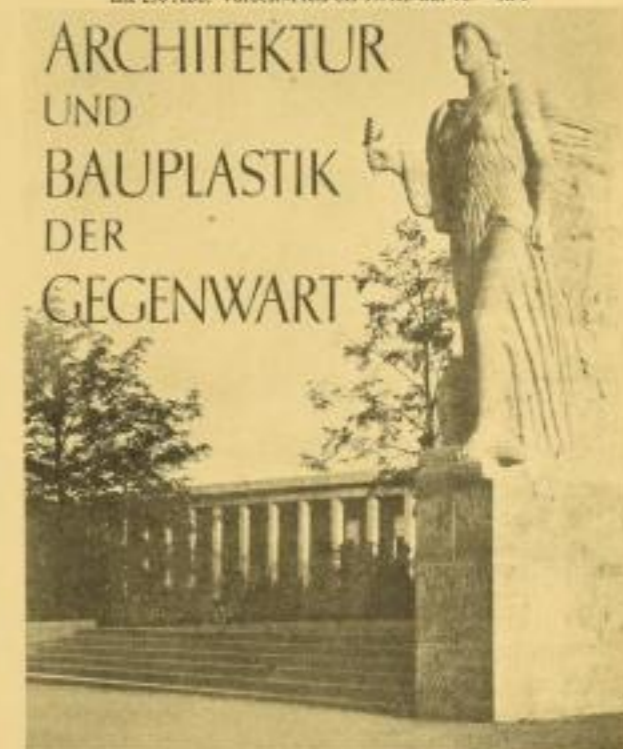
von Werner Ritsch mit 150 Abbildungen. Kartoniert 5.80, Leinen 7.80