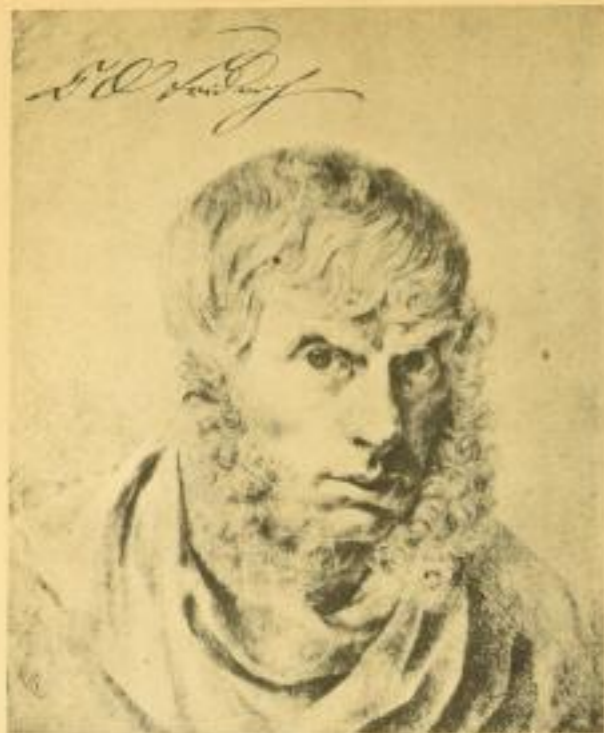
von Herbert von Einem Mit 100 Abbildungen. Kartoniert nur 4.80, Leinen 6.50