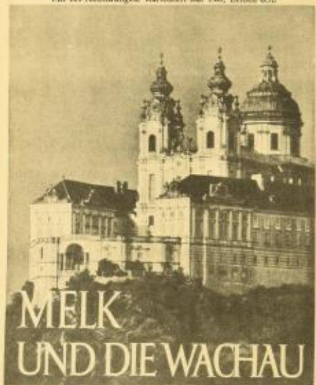
von Walter Flatz mit 100 Abbildungen. Kartoniert 4.80, Leinen 6.50