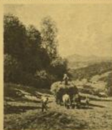
Deutsche Heimat - Kunstkalender 1940