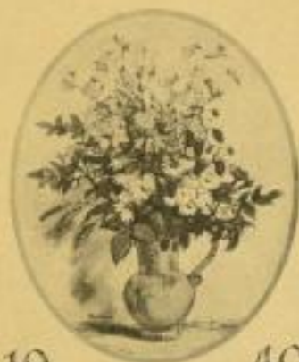
Ackermanns Blumenkalender 1940