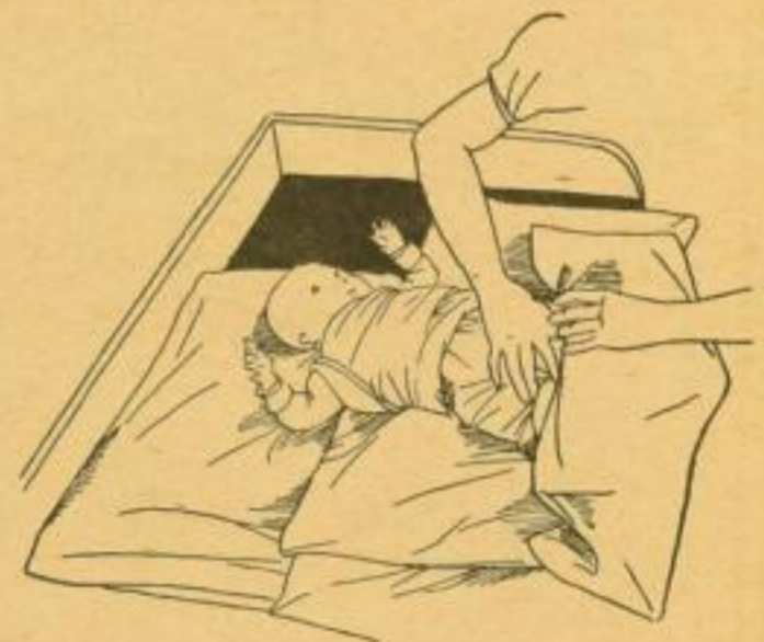
Das Bündel nicht zu fest, dann bleibt der Kleine froh und heiter.