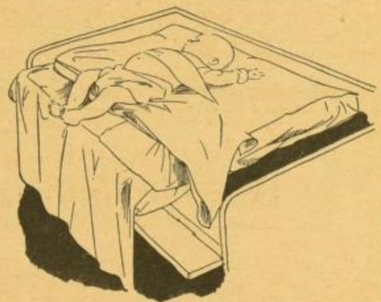
und so geht es weiter!