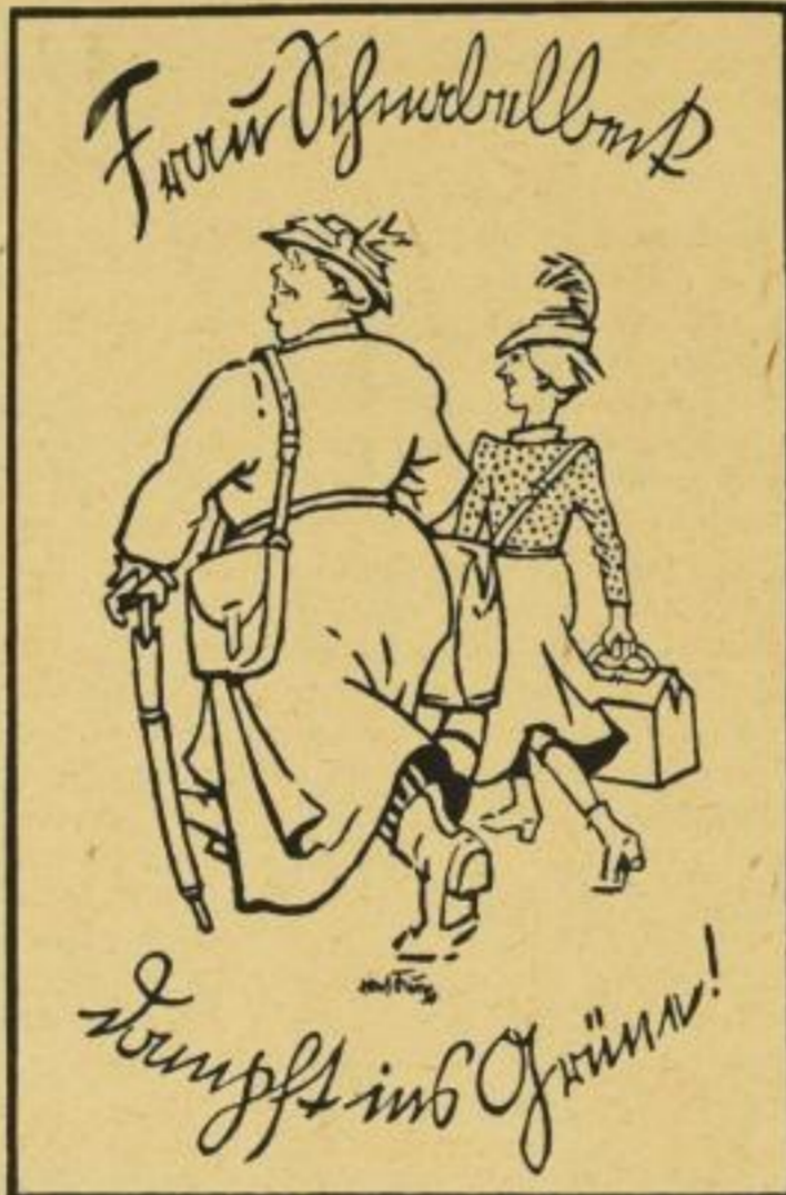
Verkleinerung des mehrfarbigen Schutzumschlages

Eine vergnügliche ländliche Erzählung von allerlei Liebe, verschiedenen Tieren und einigen Philistern