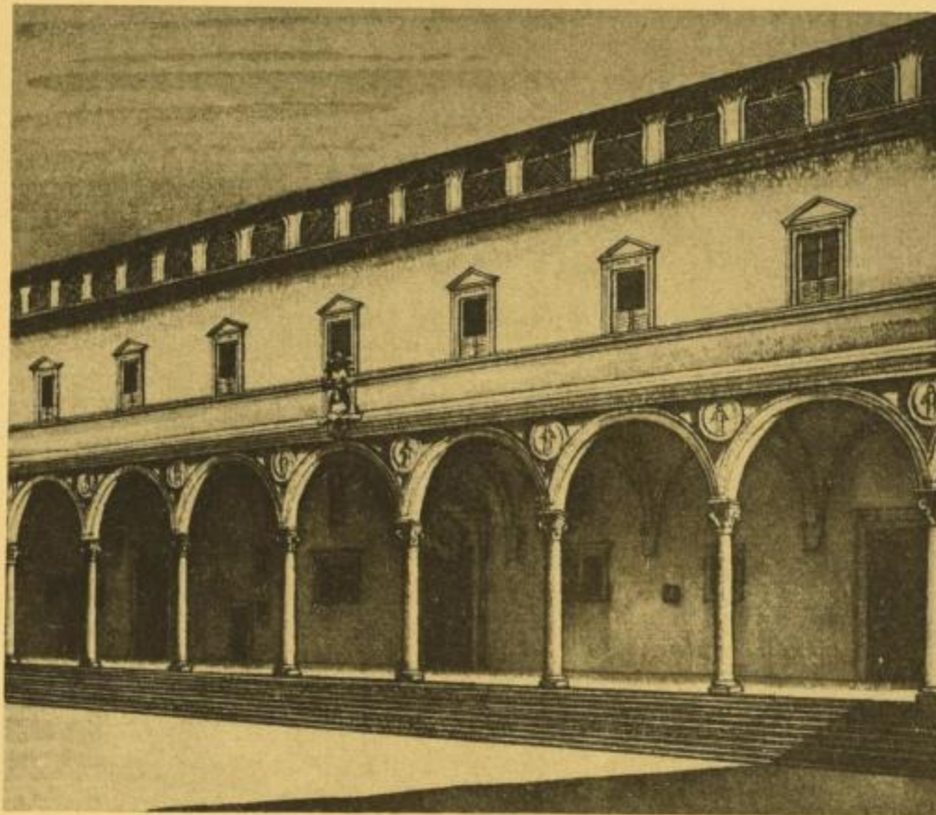
Die Arkaden des Fintelhauses zu Florenz

Nach langjähriger Vorbereitung erscheint Ende Oktober