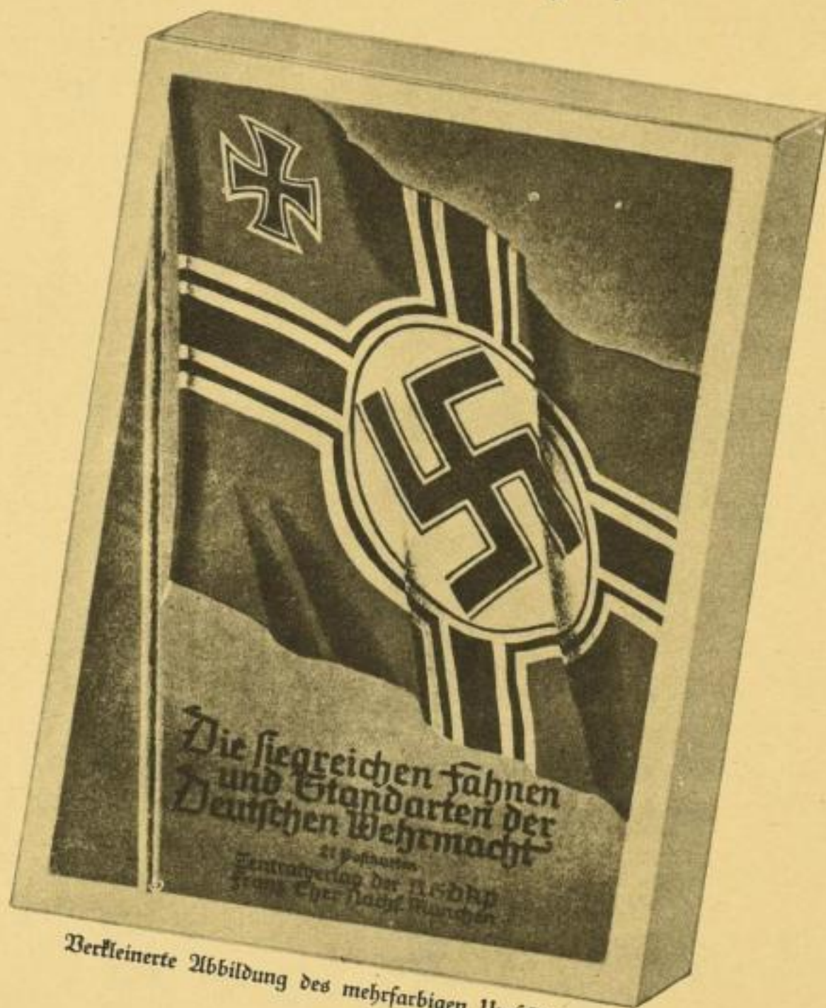
Verkleinerte Abbildung des mehrfarbigen Umschlages

21 Postkarten in 6—8 farbigem Offsetdruck nach Entwürfen von Kunstmaler Gottfried Klein, München.