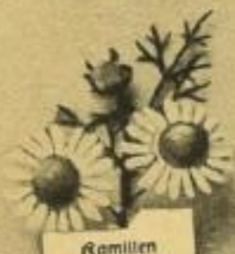
Kamillen Sammeln werden: Blütenköpfe