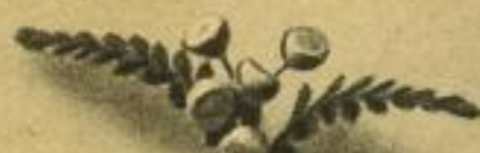
Rainfarn Sammeln werden: Blatt, Stängel, Wurzel