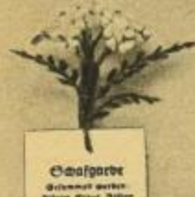
Schafgarbe Sammeln werden: Blüten, Stängel, Wurzel