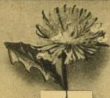
Löwenzahn Sammeln werden: Sommer, Herbst Dürrer, Stängel