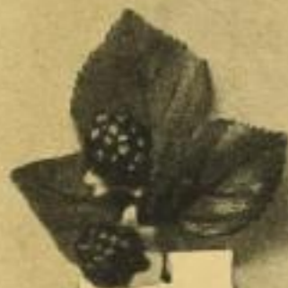
Himbeere Sammeln werden: Sommer, Herbst