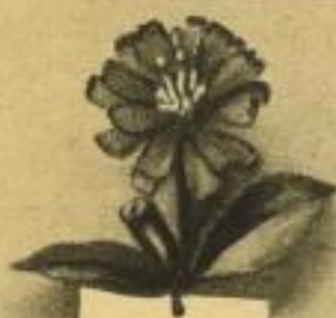
Wegwarte Sammeln werden: Jahreszeiten