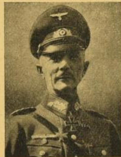
Reichsminister Dr. Goebbels