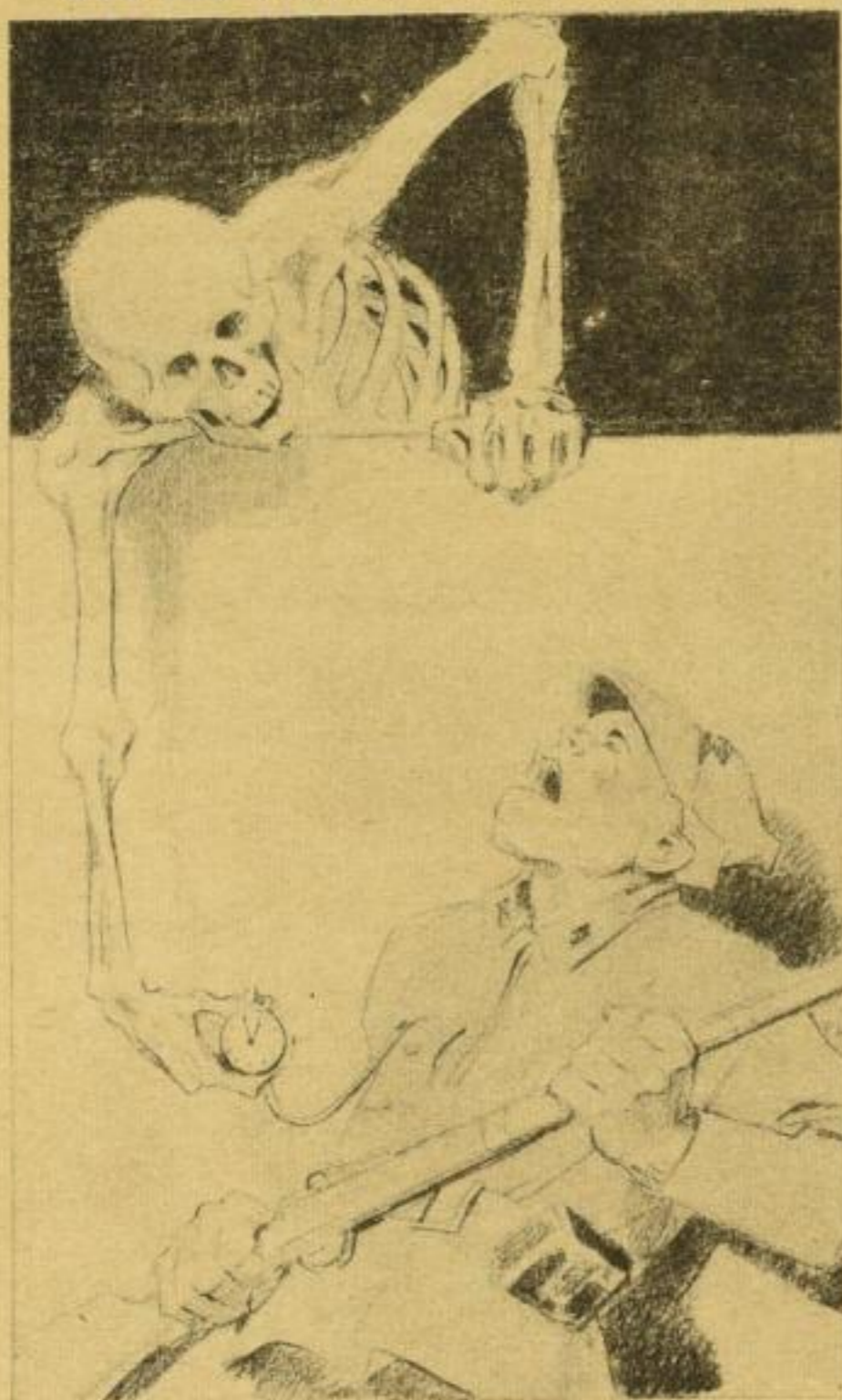
Spuk an der Kremelmauer