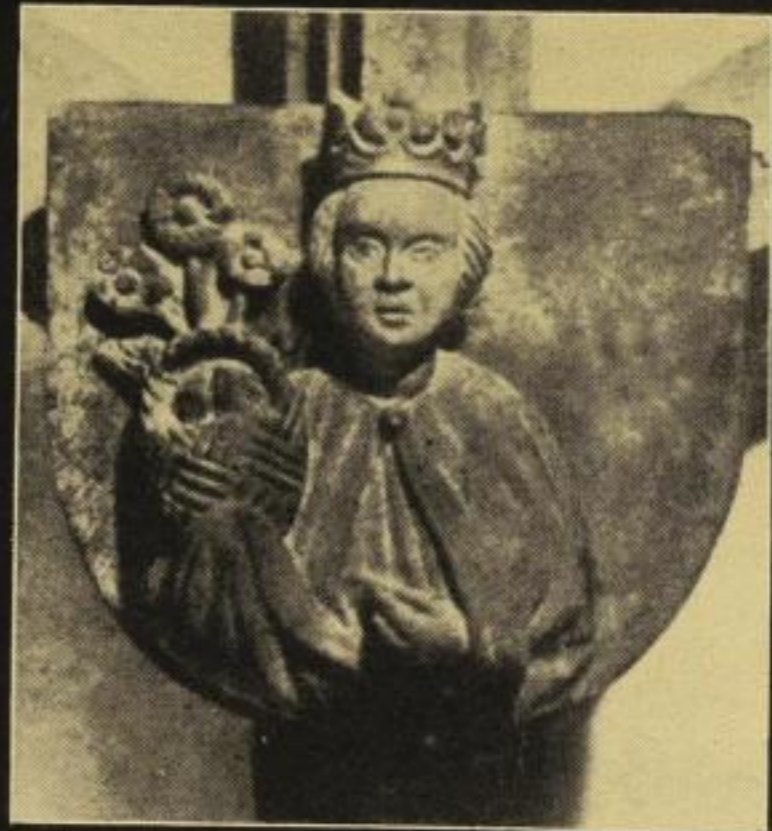
Rathaus, Schlußstein im Remter