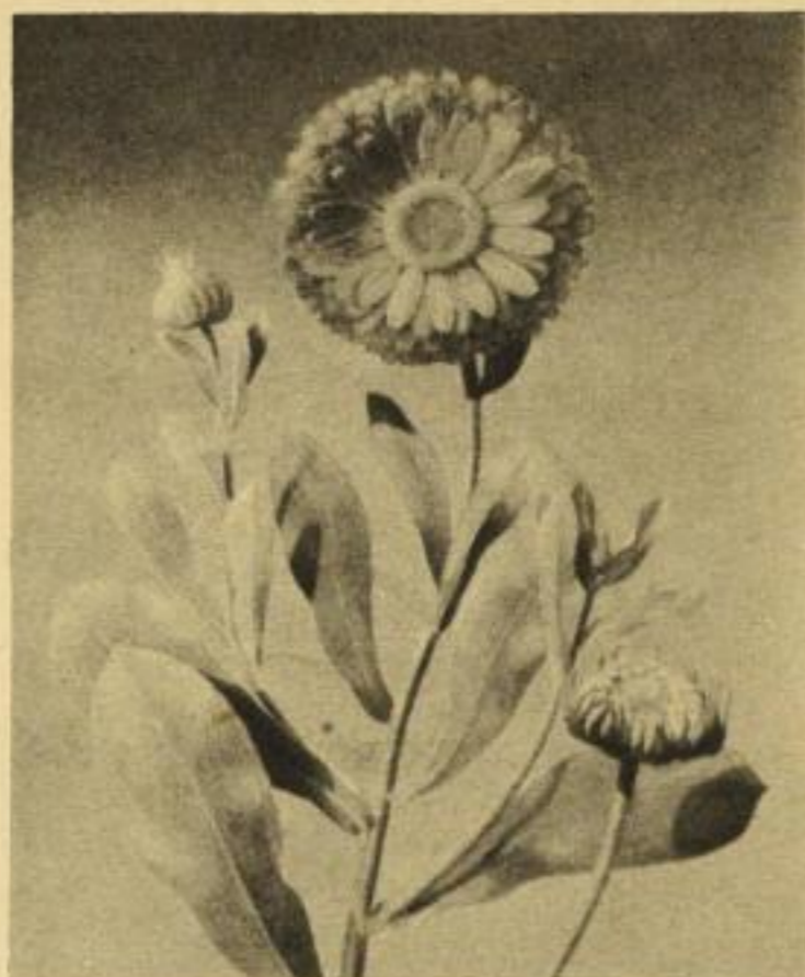
Ringelblume · CALENDULA OFFICINALIS L.