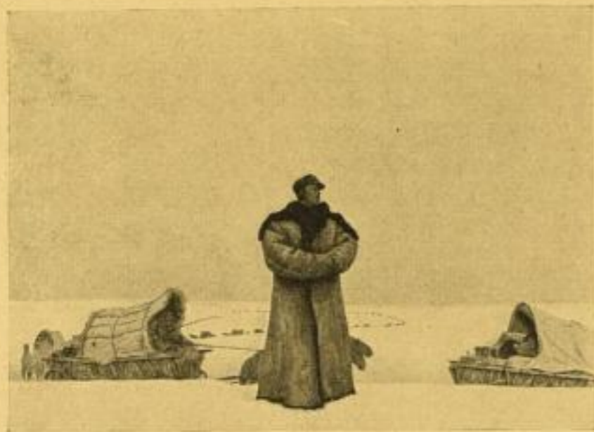
„Der Große Treck“

Nr. 18022. Farbiger Handkupferdruck Bildgr. 66:86 cm, Papiergr. 85:115 cm RM 70.- Lpr. gerahmt etwa RM 130.- Lpr., je nach Leiste